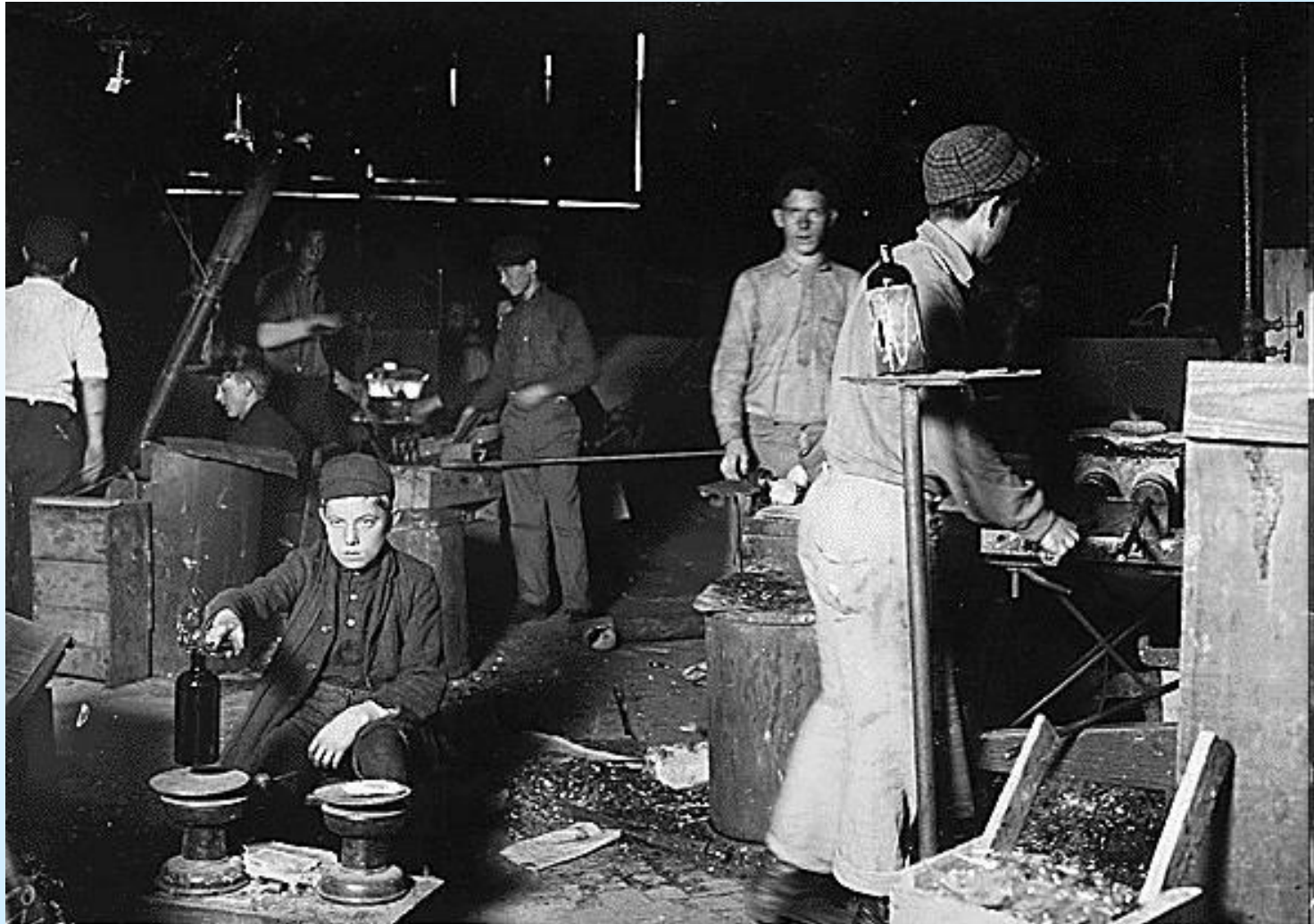
Chlapci 13 -15 roční pracují v sklárni.