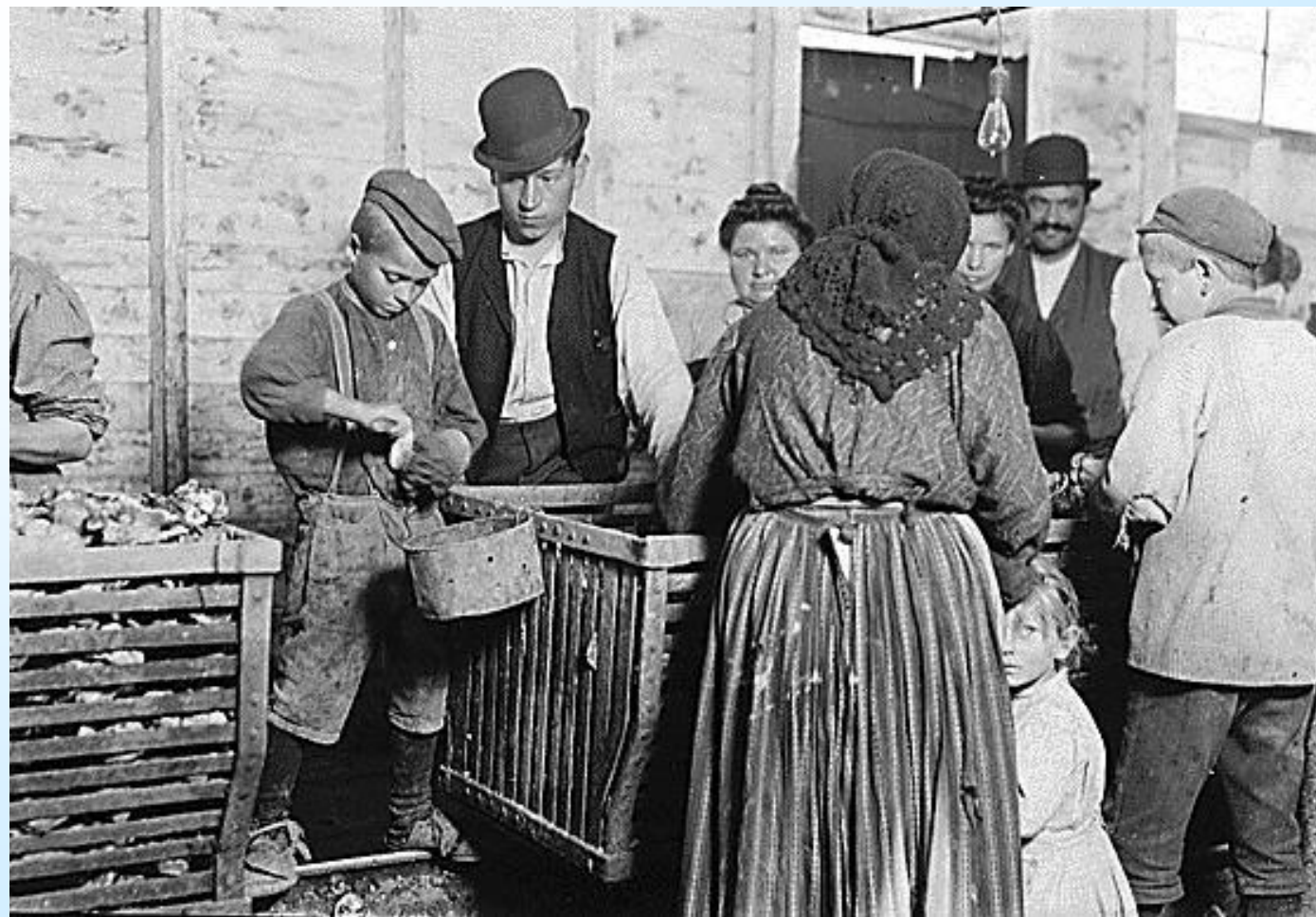
Chlapec triedi ustrice.