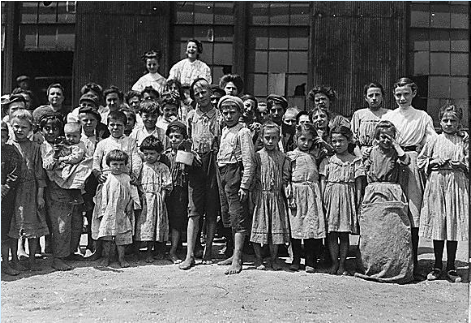
Deti, ktoré pracovali v Baltimore, USA.