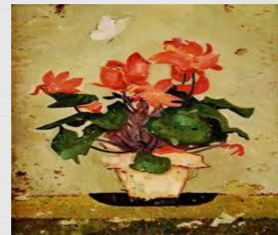
Maľba od Ľ. Fullu