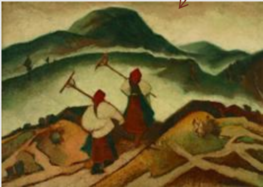
Tot o dielo sa volá „Dve ženy“

☞ Výtvarné umenie sa mohlo popýšiť aj majstrovskými dielami od Martina Benku , či Miloša Alexandra Bazovského