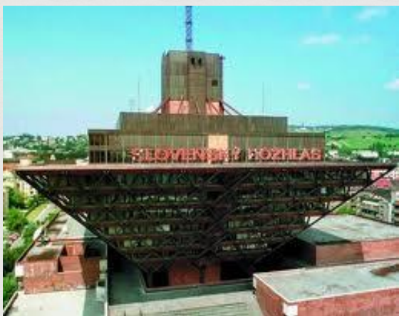
Budova slovenského rozhlasu