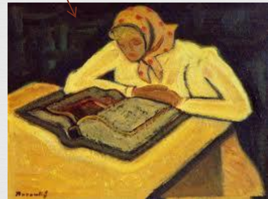
Toto dielo dostalo pomenovanie „Čítajúca“