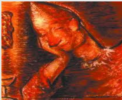
Maľba od M. Galadnu

Prostredníctvom ŠUR, kde pôsobili ako učitelia mali kontakty s poprednými svetovými umelcami