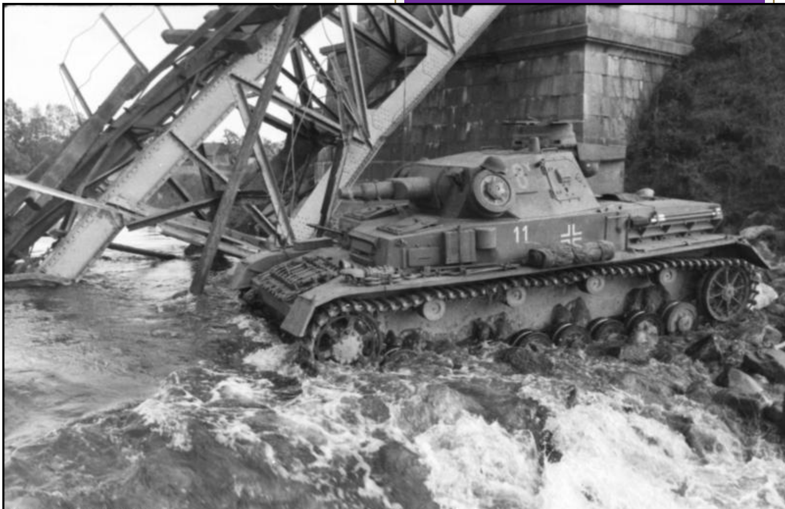
1941 Juni - Juli

Nemecký tank prekračuje rieku pri zničenom moste počas bojov smerom na Leningrad (Zdroj: http://sk.wikipedia.org/wiki/Operácia_Barbarossa )