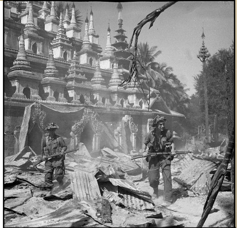
Britskí vojaci brániaci územie Barmy