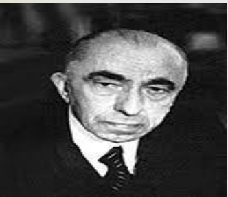
Emil Hácha prezident Č-SR

Prezident Hácha odvolal autonómnu vládu Jozefa Tisu a vymenoval 11. marca 1939 novú autonómnu vládu na čele s Karolom Sidorom