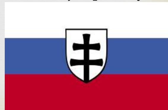
Vojenská vlajka Slovenskej republiky