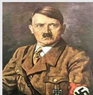
Prvá slovenská republika (1939 – 1945)